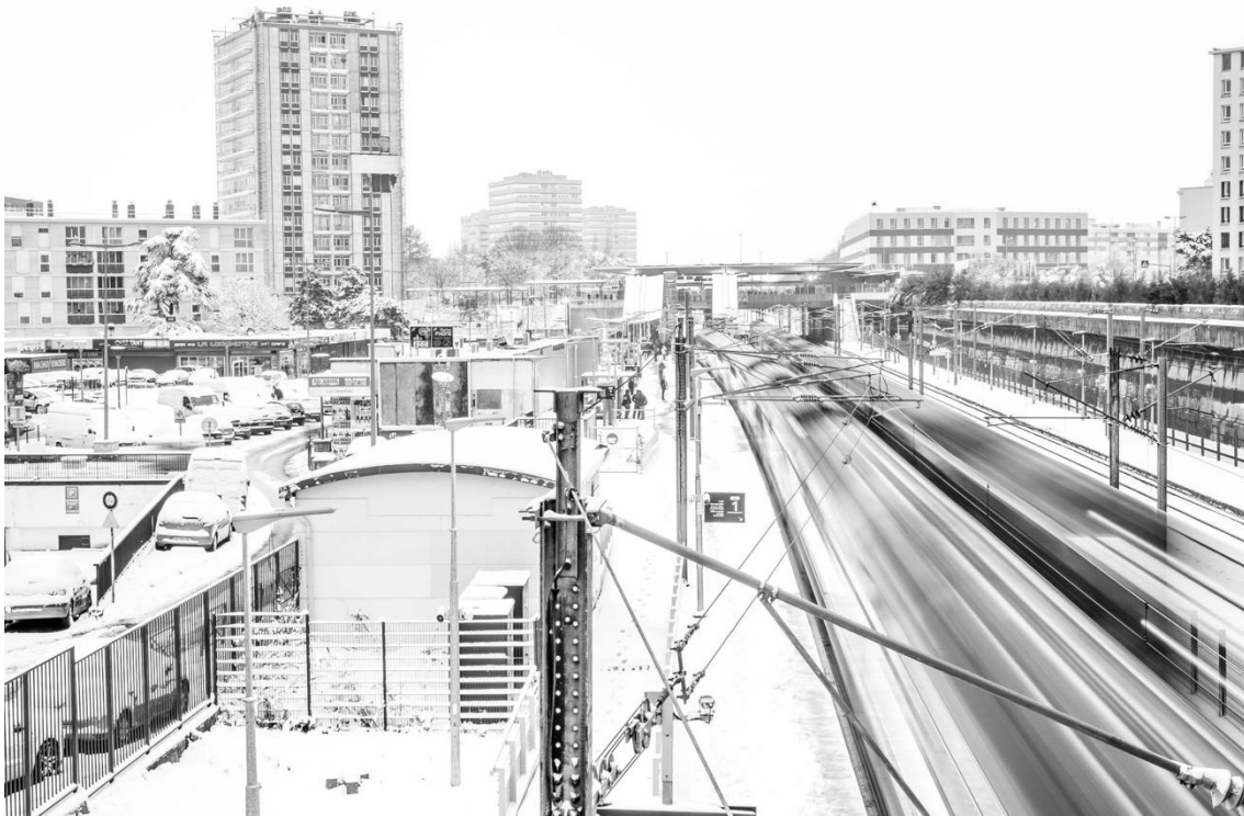
Figure 1. Gare de Sarcelles sous la neige (2018)

Photo : C. Leon-Quijano, 2023. Extraite du livre La cité. Une anthropologie photographique (Éditions de l'EHESS, 2023).