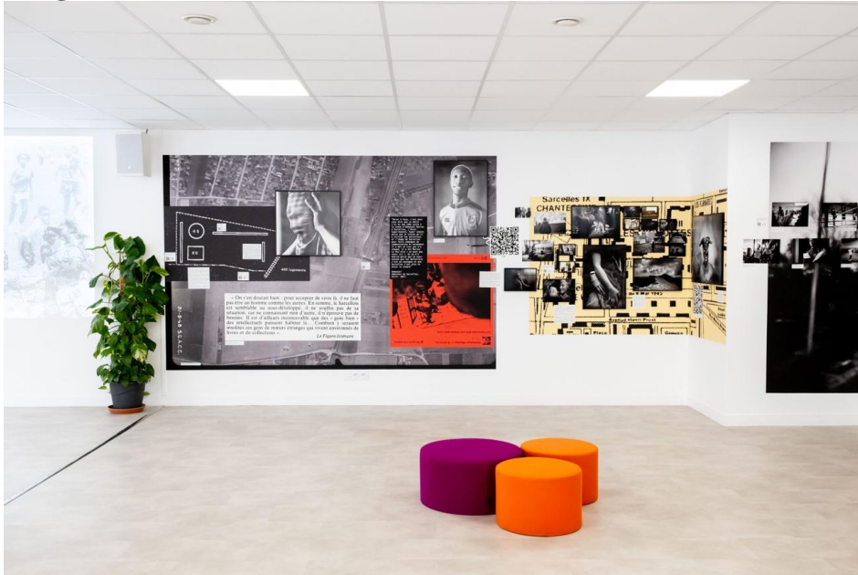
Figure 5. Exposition La Cité : une anthropologie photographique , médiathèque Anna-Langfus (Sarcelles, 2023)

Anna-Langfus, haut lieu culturel du Grand Ensemble 9 . Cet événement était à la fois un moment de rencontre et de partage des matériaux visuels issus de ma pratique photo-ethnographique. Ce moment d'échange a été l'occasion d'explorer à nouveau les attentes, les regards et les appréciations de certaines personnes qui ont vu leur image exposée en grand format pour la première fois.